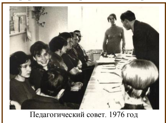
Педагогический совет. 1976 год

Методическое сопровождение – необходимое условие деятельности любого педагогического коллектива. Первые организованные выезды на методические конференции в город Новосибирск состоялись уже в 1950 году.