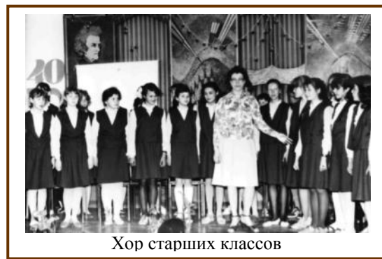
Хор старших классов

Свыше 200 мероприятий для разных возрастных и социальных категорий населения проводит ежегодно школьная филармония, созданная в середине 70-х. Выполняя свою основную культурно-просветительскую функцию, она одновременно предоставляет и преподавателям и юным музыкантам неограниченные возможности для совершенствования исполнительского мастерства.