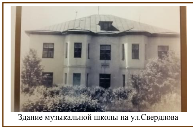
Здание музыкальной школы на ул.Свердлова