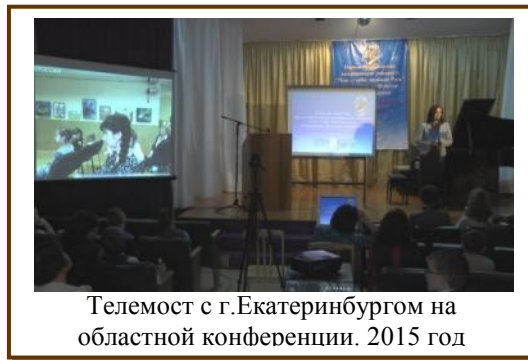
Телемост с г.Екатеринбургом на областной конференции. 2015 год