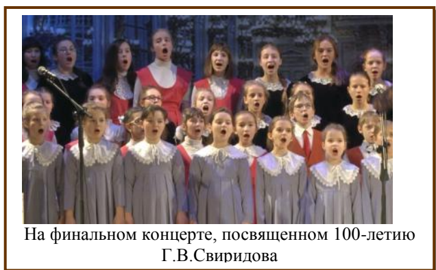
На финальном концерте, посвященном 100-летию Г.В.Свиридова

Широкую известность и признание получили новые проекты: областная научно-практическая конференция учащихся ДМШ и ДШИ «Пою о тебе, великая Русь» и областная научно-практическая конференция преподавателей «Размышления вслух».