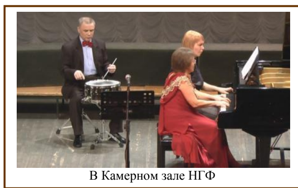
В Камерном зале НГФ

Бердской детской музыкальной школе имени Г.В.Свиридова - 70 лет! Оценивая результаты многогранной деятельности учреждения и его вклад в социальное развитие города Бердска, творческий коллектив школы наметил новые перспективы и смотрит в будущее с большой надеждой и оптимизмом!